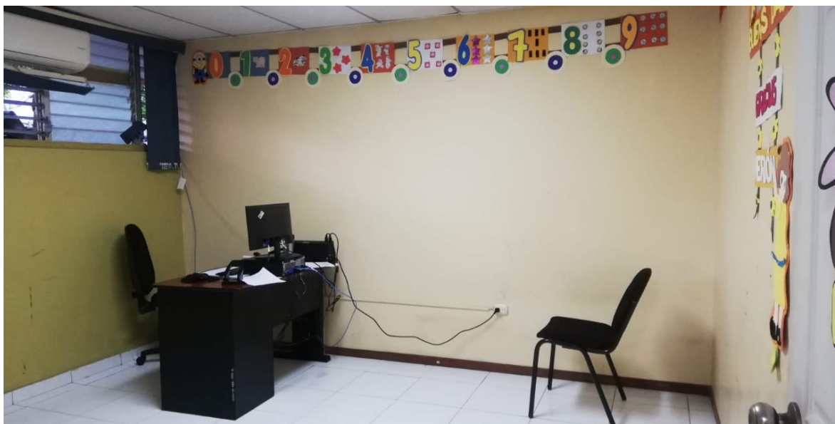
Recepción (Secretaria Administrativa)